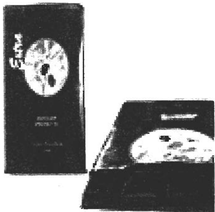
エクストラチョコレート ¥510