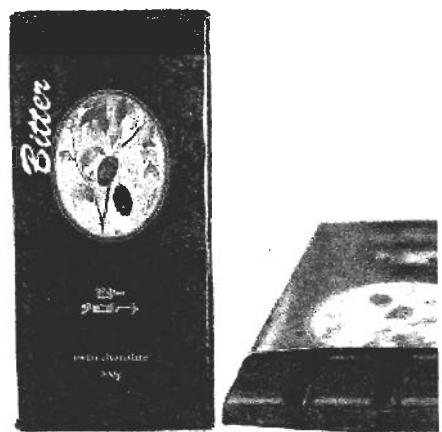
ビターチョコレート ¥510