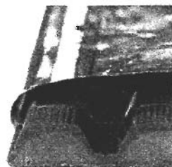
ウィンターチョコレート ¥650