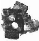
ヘーゼルナッツ 750円

原材料のほとんどが、自然あふれる農園で、 顔が見える生産者たちが育てたもの。 たっぷり愛情を込めて作られたフェア トレードチョコレートは、作る人と 食べる人、みんなの心を甘くハッピー にしてくれます。