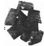
ソルト&クランチ 650円