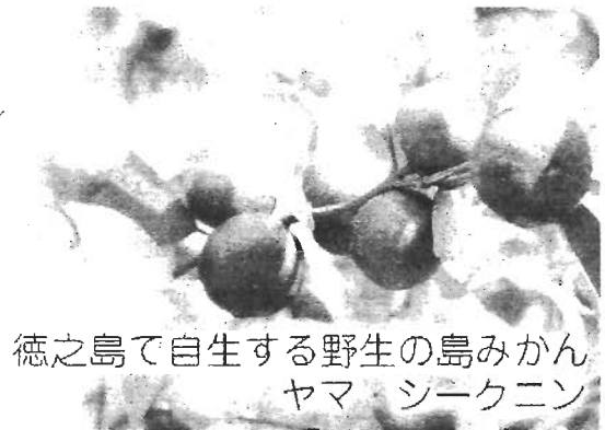
徳之島で自生する野生の島みかん ヤマ・シークニン

徳之島の珊瑚礁と豊かな自然に生まれ、みずみずしい実をつけているヤマ・シークニン。長寿と健康の島ならではの島みかん、ヤマ・シークニンは原野を採取して集められたみかんです。正真正銘、農薬などは全く使用しておりません。