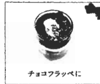
チョコフリップに