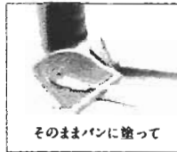
そのままパンに塗って